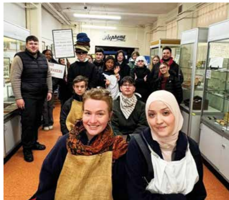
Die Gruppe besichtigte das Pen Museum in Birmingham.

Den Austausch in die Wege geleitet hatten Mitarbeiterinnen und Mitarbeiter des Gulfhauses und des Jugendzentrums „The Way“ in der mittelenglischen 260.000-Einwohner-Stadt. Der Kontakt war dank der Förderung des