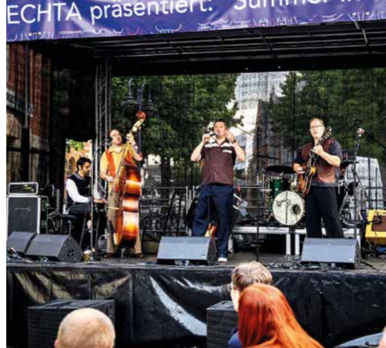
Die Band Crazy Daves bei Ihrem Auftritt im vergangenen Jahr.

Bereits am Mittwoch, 10. Juni, gibt es einen ersten sommerlichen Vorgeschmack: Im Rahmen des Sommerfests der Universität Vechta