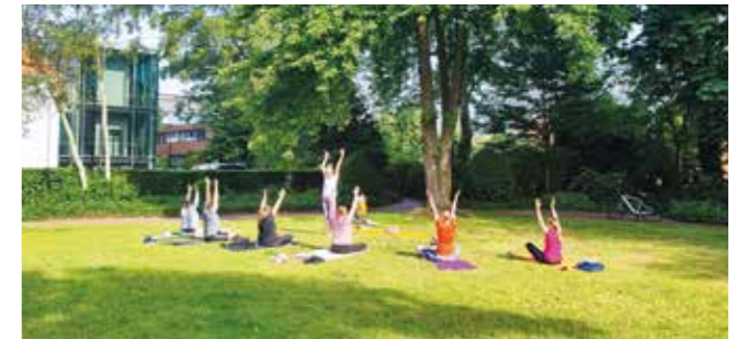
Auch Yoga-Kurse gehören wieder zum vielfältigen Programm von „Sport im Park“ in Vechta.