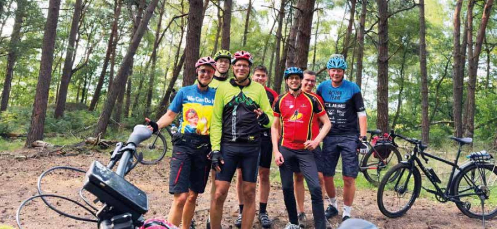
Die MTB- und Gravelbike-Fahrradtouren starten in Füchtel.