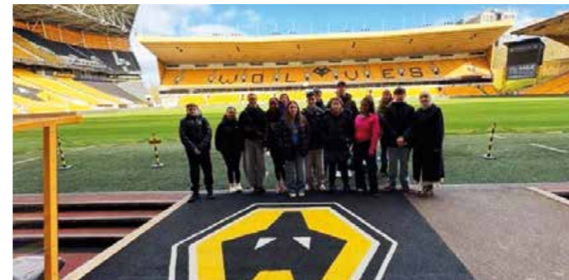
Die Gruppe besichtigte das Wolves Molineux Stadium Tour in Wolverhampton.

Rotary Clubs Vechta entstanden. Die Bildungsreise konnte mit Fördermitteln der Bürgerstiftung Vechta und des Landes Niedersachsen realisiert werden.