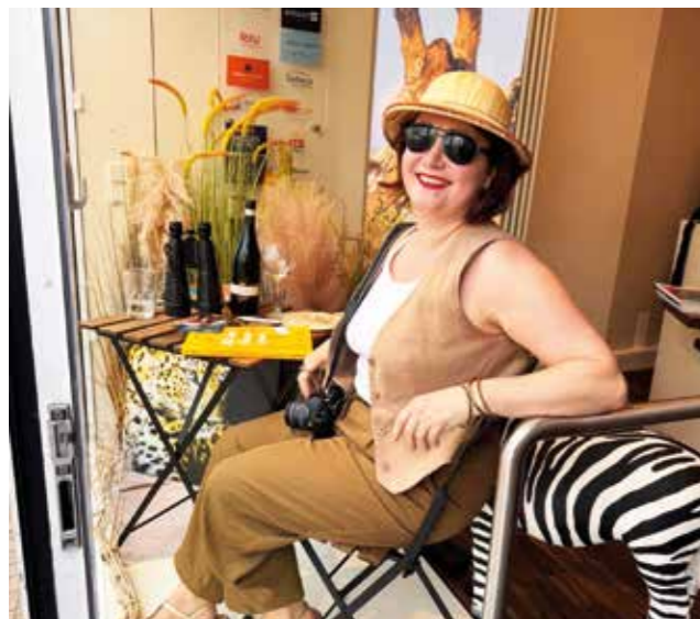
Das Schaufenster vom Reisebüro Willmering mit dem Motto „Safari“ im vergangenen Jahr.

Die Schaufenster in der Innenstadt erwachen in diesem Jahr erneut zum Leben.