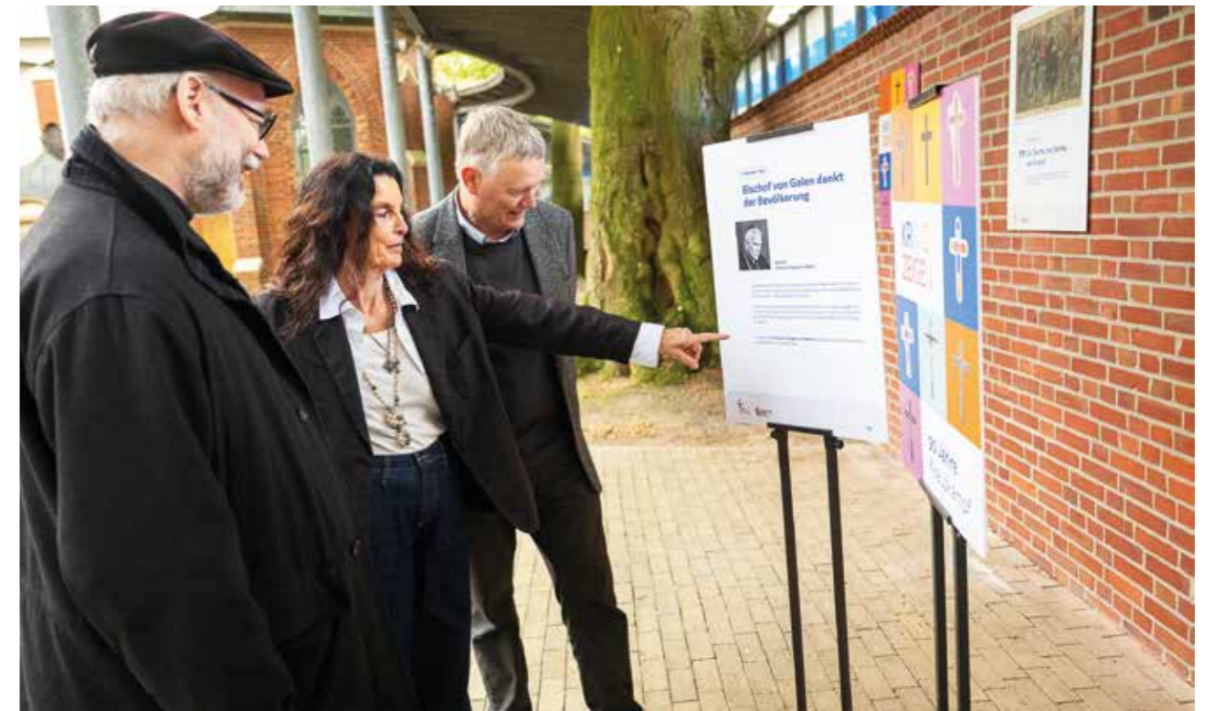
Die Ausstellung gibt es in zwei Ausfertigungen: als Dauerausstellung in Bethen an der Mauer hinter der Gnadenkapelle und als mobile Indoor-Ausstellung, die ausgeliehen werden kann.