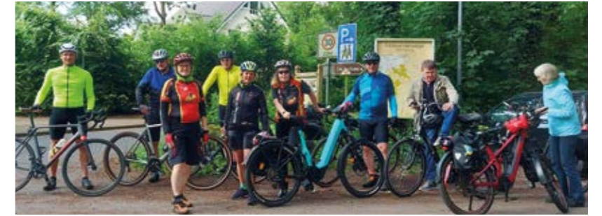
All diese Geschichten machen deutlich, dass das Oldenburger Münsterland von Gemeinschaft, Wandel und dem Mut lebt, neue Wege zu gehen.

Der Mai bringt Energie nach Vechta. Die Tage werden länger, das Leben verlagert sich nach draußen, zeigt sich, wie vielfältig, engagiert und lebendig das Miteinander ist.