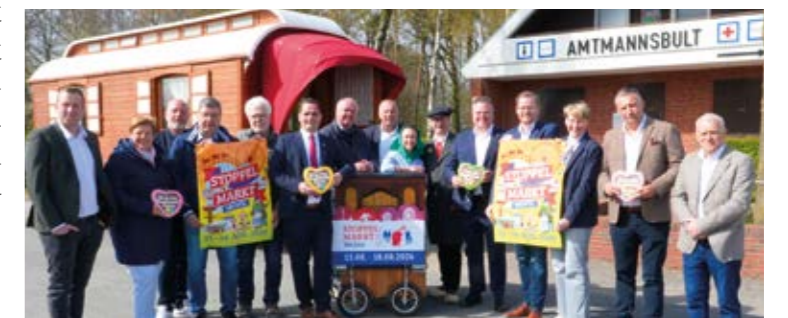
Vechtas Kommunalpolitiker und Schausteller freuen sich über die Aufnahme als immaterielles Kulturerbe.