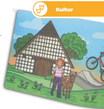
Text: Heimatbibliothek für das Oldenburger Münsterland

Die feierliche Preisverleihung findet im Rahmen des großen Sommerfestes am 6. Juni 2026 statt, zu dem die Heimatbibliothek anlässlich ihres Jubiläums einlädt. Das Fest ist öffentlich und richtet sich an alle Interessierten – insbesondere Familien, Kinder und alle, die die Heimatbibliothek kennenlernen oder neu entdecken möchten. Neben Hüpfburg, Bücherflohmarkt und weiteren Aktionen erwartet die Besucherinnen und Besucher ein besonderes Highlight: Alle eingereichten Werke werden im Außenbereich der Bibliothek ausgestellt. So entsteht eine bunte Open-Air-Galerie, die zeigt, wie vielfältig und kreativ Kinder ihre Heimat im Oldenburger Münsterland gestalten.