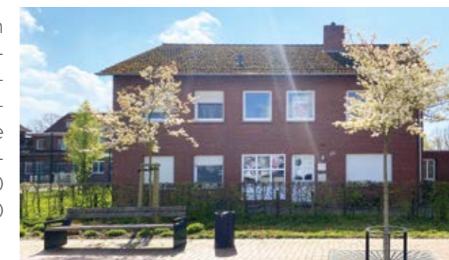
Der Jugendtreff ist jetzt im Gebäude neben der Schule.

Der Jugendtreff „Freiraum“ ist in Langförden am neuen Standort deutlicher ins Blickfeld gerückt. Er liegt jetzt direkt an der Hauptschlagader des Ortes, der Langen Straße (Hausnummer 39), neben der Schule und in Sichtweite der St. Laurentius-Kirche. Geöffnet hat der Jugendtreff dienstags bis donnerstags von 15.00 bis 19.00 Uhr sowie freitags von 15.00 bis 20.00 Uhr.