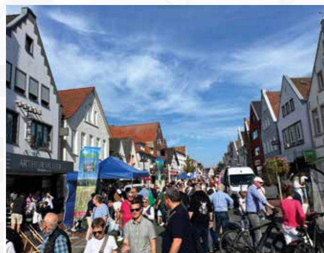
Moin Vechta richtet jährlich den Vereinstag aus und holt hierbei tausende Besucher in die Innenstadt.

Ein weiteres Highlight der Sommermonate ist unsere Aktion „Schlemmerzeit“. Von Anfang Juni bis Ende August laden teilnehmende Gastronomen dazu ein, Vechta kulinarisch zu entdecken: Jedes Restaurant bietet ein exklusives Gänge-Menü für zwei Personen zum Festpreis von 65 €. Wer ein besonderes Geschenk sucht, kann auch einen Schlemmerzeit-Gutschein erwerben – erhältlich direkt bei Moin Vechta.