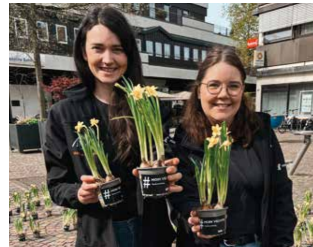
Kleine Aufmerksamkeiten wie Frühlingsblüher werden an alle Passanten verteilt und sollen den Besuch in Vechta verschönern.

Dabei müssen verschiedenste Interessen berücksichtigt und ausbalanciert werden – von Einzelhändlern über Gastronomen bis