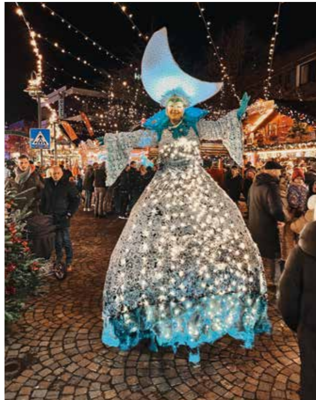
Moin Vechta plant ein abwechslungsreiches Programm zum Langen Einkaufsabend, wie eine funkelnde Stelzenkünstlerin.