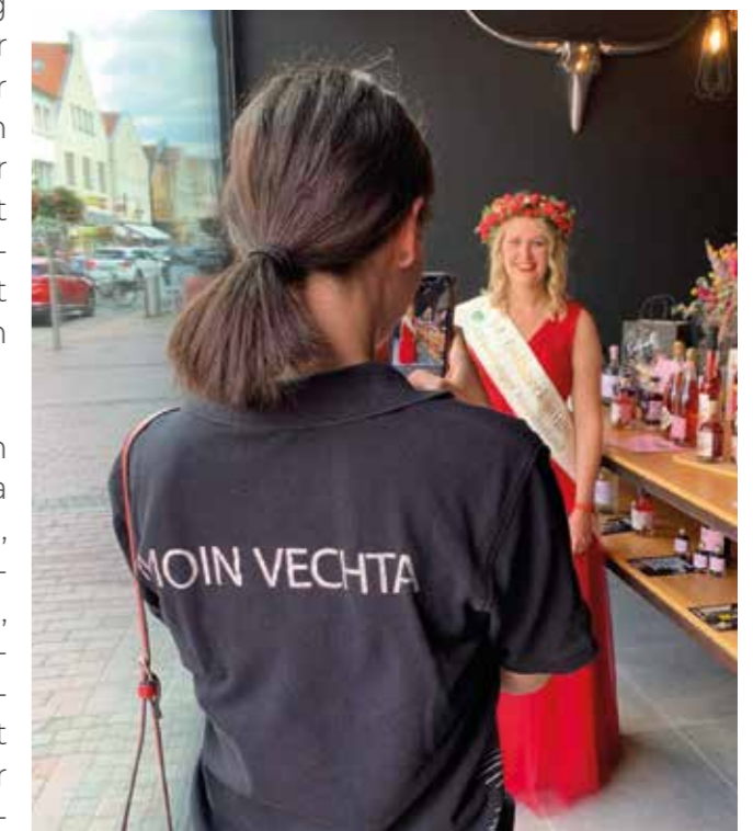
Moin Vechta organisiert Aktionstage zur Attraktivitätssteigerung der Innenstadt, wie hier den Erdbeertag.