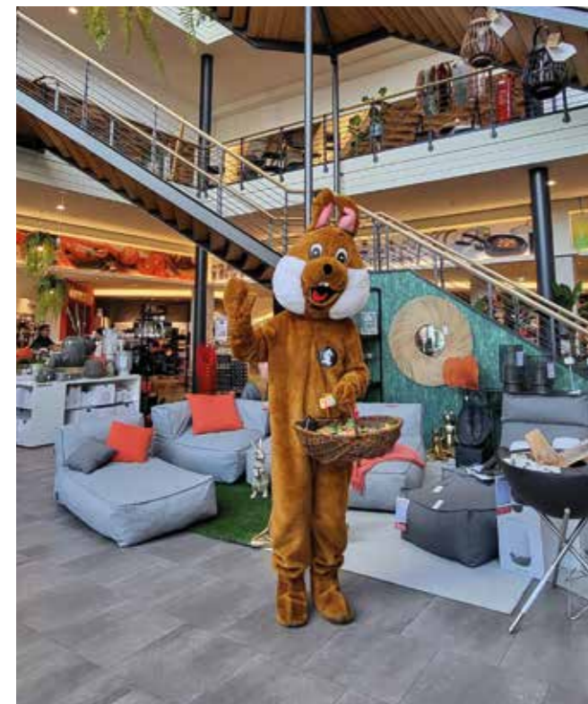
Aktionstage wie die Osterhasenaktion sind fest im Aktionskalender von Moin Vechta verankert.